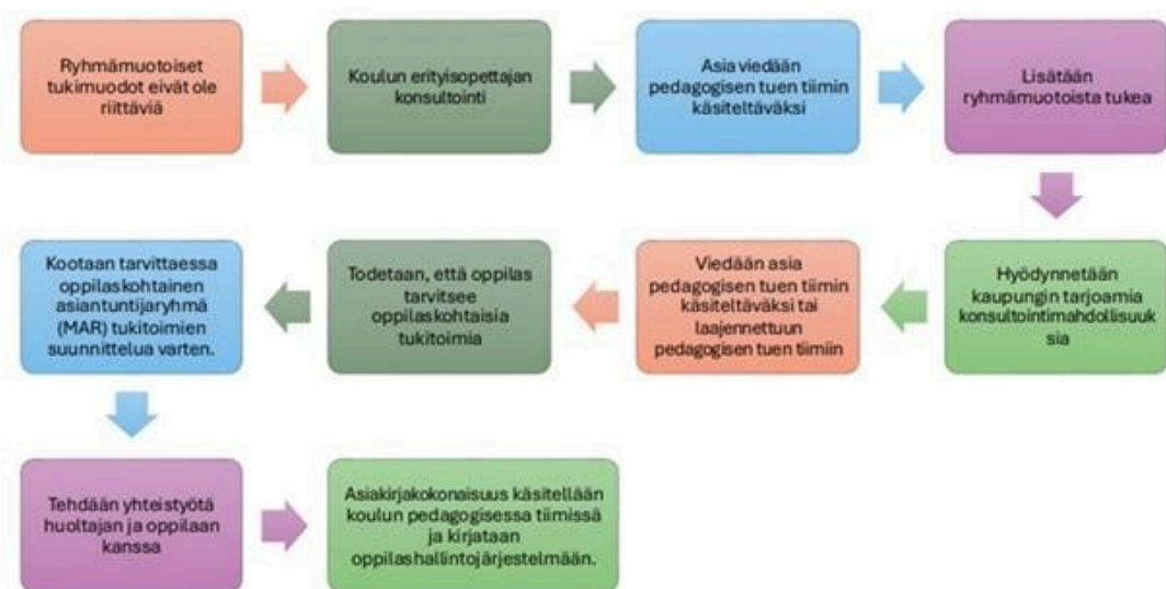
Kuva 1. Ryhmäkohtaisista tukimuodoista oppilaskohtaisiin tukitoimiin siirtyminen.